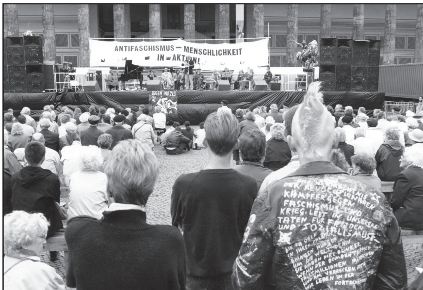
Der erste TdM am 09.09.1990.