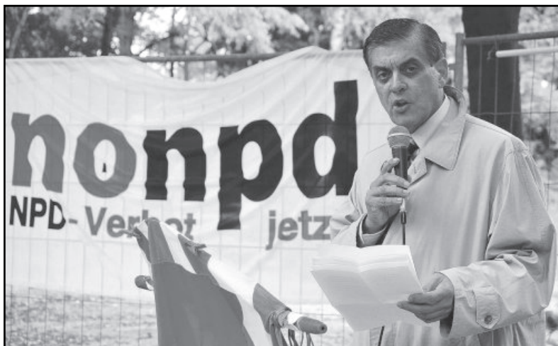
Romani Rose, Vorsitzender des Zentralrats Deutscher Sinti und Roma , appelliert beim TdM 2008 an die Politik, das geplante Mahnmal für die von den Nazis ermordeten Sinti und Roma fertigzustellen.