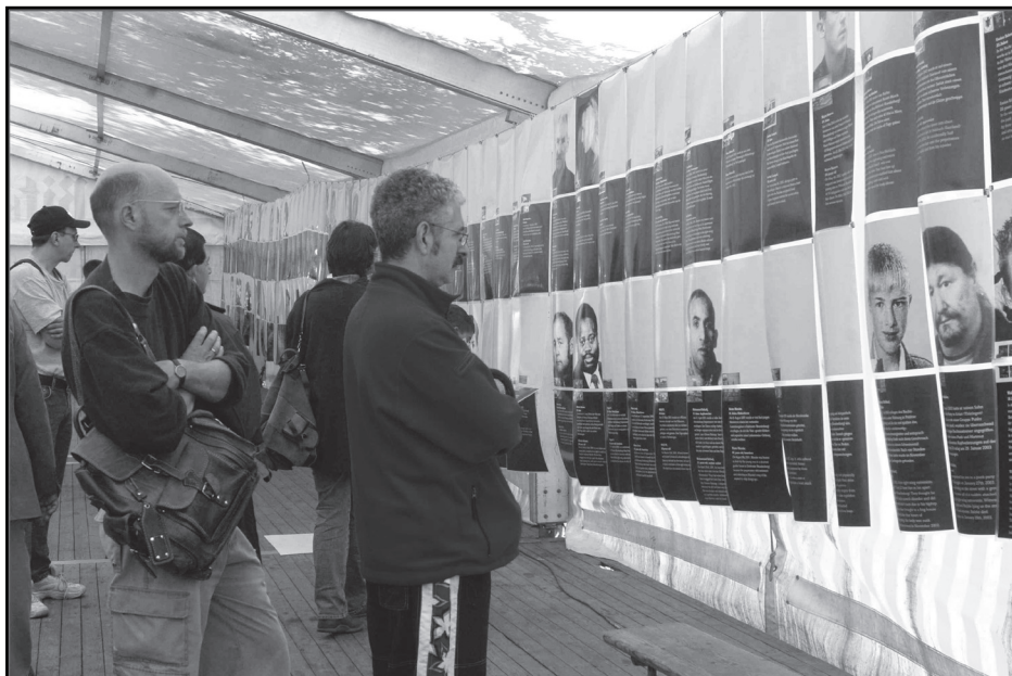
Ausstellung Opfer rechter Gewalt in Deutschland seit 1990 des Vereins Opferperspektive auf dem TdM 2004.