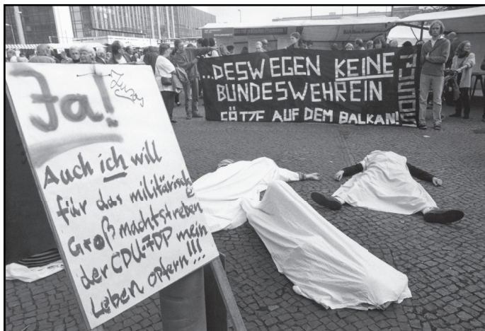
Aktion gegen Einsätze der Bundeswehr 1995.