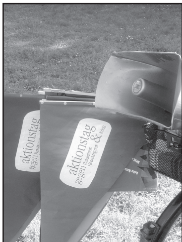
Die Ausrüstung für den antifaschistischen Fahrradkorso.