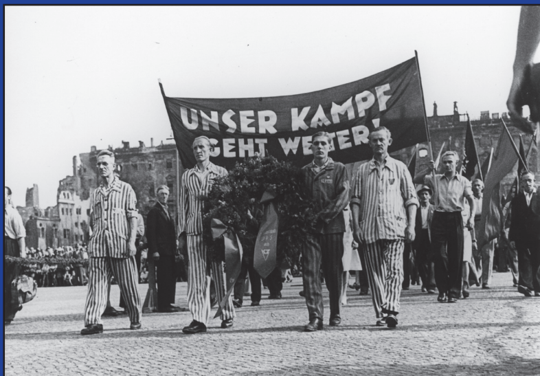
Auf dem Weg zur Gedenk Kundgebung im Lustgarten 1947.

In den 1950er Jahren verändert sich das Gedenken an die Opfer des Nazi-regimes in beiden deutschen Staaten grundlegend. Im Westen wird im Zeichen von Totalitarismus-Theorie und Antikommunismus nun allen Opfern von Gewaltherrschaft vor und nach 1945 am Volkstrauertag gleichermaßen gedacht und der zweite Sonntag im September zunehmend vergessen. Menschen, die von den Nazis verfolgt wurden, sind nur noch ein Teil des Gedenkens an alle Opfer von Krieg und Gewalt. Gleichzeitig wird der Widerstand aus der Arbeiter_innenbe-