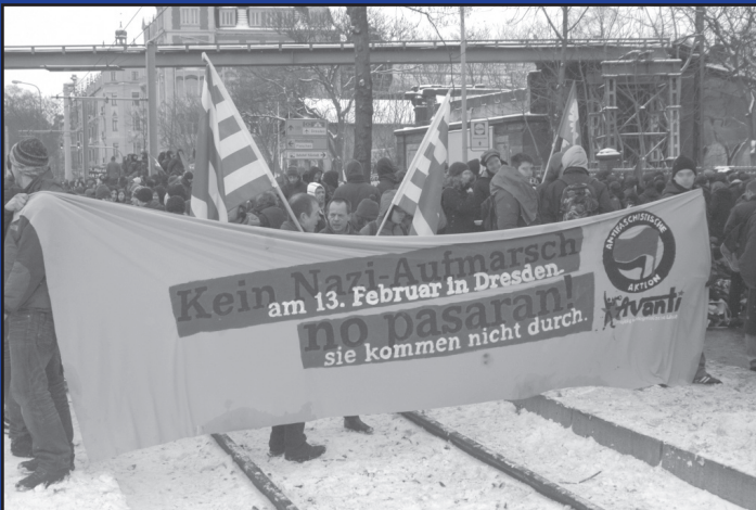
Blockade vom Neonazi-Aufmarsch am 13.02.2010 in Dresden.

ermöglicht ihr Fehlen Historisierung, Verharmlosung und Leugnung des von ihnen Erlebten, wodurch der TdM ein zweites Mal an Bedeutung verlieren kann: Woran soll erinnert werden, wenn es scheinbar nur Geschichte ist, harmlos oder nie passiert?